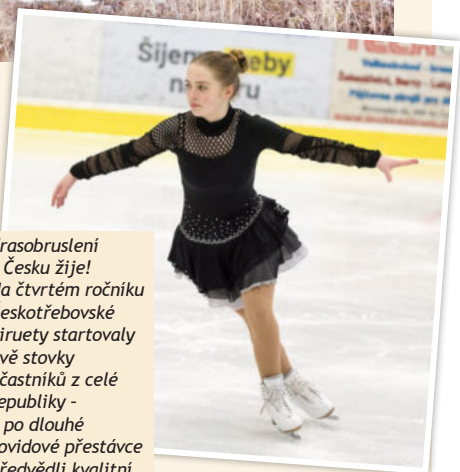
Krasobruslení v Česku žije! Na čtvrtém ročníku Českotřebovské piruety startovaly dvě stovky účastníků z celé republiky - a po dlouhé covidové přestávce předvedli kvalitní výkony.