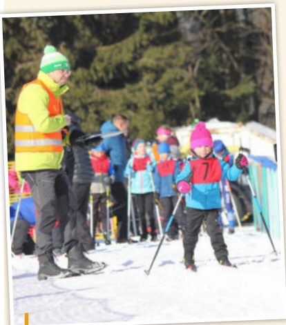
V pořadí 61. ročník Telnické 15 v běhu na lyžích nezastavila ani nečekaná obleva - mezi stovkou akτέρů závodili i nejmenší děti

Lyže ve všech podobách, ale také krasobruslení, turistika nebo moderní gymnastiky tvořily hlavní náplň únorových akcí projektu České unie sportu - Tipsport Sportuj s námi. Vzhledem k postupnému uvolňování epidemických restrikcí se jich také zúčastnilo mnohem více vyznavačů sportu a pohybu z řad veřejnosti. Několik vydařených akcí přibližujeme prostřednictvím zaslaných fotografií.