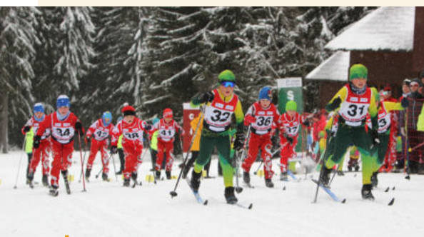
Na tratích v okolí skiareálu Jahodová louka na Božím Daru se vystřídalo v závodu o Štit Krušných hor 158 běžců.