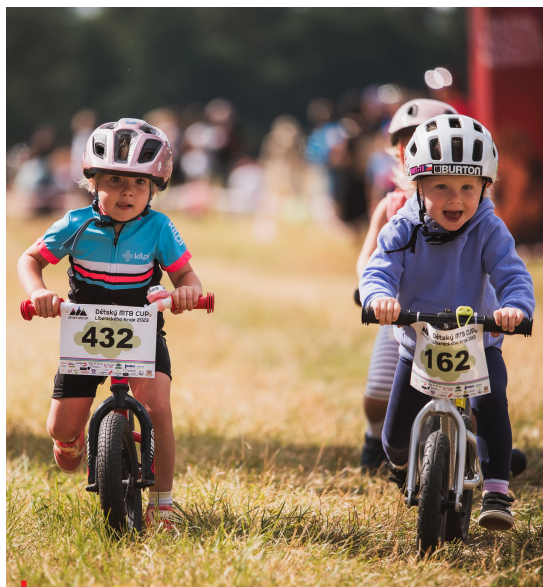
Tam, kde není registrováno dvacet mladých sportovců, kluby už na dotaci od NSA nedosáhnou

Členové Výkonného výboru ČUS reagovali na důsledek novely zákoníku práce a přijetí tzv. vládního konsolidačního balíčku. V něm obsažená nová právní úprava uzavírání dohod o pracích konaných mimo pracovní poměr - především dohod o provedení práce (DPP) - se velice negativně dotkla celého sportovního prostředí a nesmírně komplikuje, často dokonce znemožňuje použití tohoto smluvního nástroje.