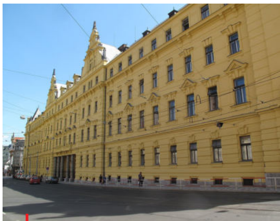
Budova Městského soudu v Praze